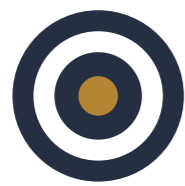
CAMP 1 STRATEGISK TÆNKNING

Som ekstra benefit ved tidlig tilmelding til dit MBA studie, sætter vi turbo på din evne til problemløsning gennem fire gratis Start Up Bootcamps. Sammen med andre kandidater arbejder du med konkrete ledelsesudfordringer fra din egen dagligdag. Du kommer til at opleve workshops, der sætter fokus på praktisk problemløsning, der hele tiden er sat i forhold til din hverdag og dine udfordringer. Vi ønsker, at du allerede nu skal højne din interne værdi i virksomheden ved at kvalificere dig til at træffe endnu bedre beslutninger og til at føre dem ud i livet. Du bliver virksomhedens garant for fremsynet ledelse.