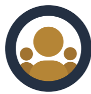
CAMP 3 LED MENNESKER