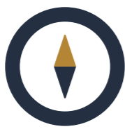
CAMP 2 NAVIGER I PARADOKSER